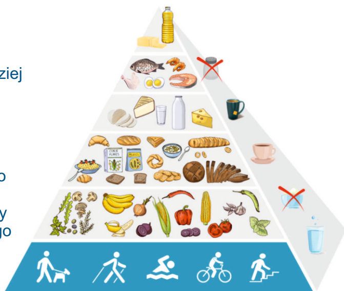
Piramida zdrowego żywienia i aktywności fizycznej

W zdrowej diecie największy udział powinny mieć kolejno warzywa i owoce, a następnie: produkty zbożowe; mleko i jego przetwory; mięso, ryby, jaja; tłuszcze (np. oliwa).