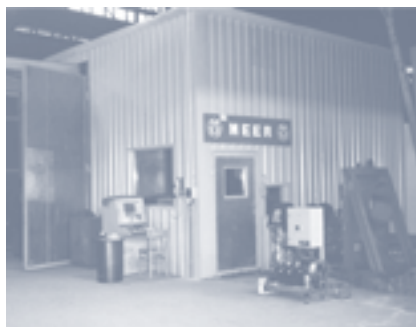
Fot. 4. Obudowa dźwiękochłonno-izolacyjna piły do cięcia rur

Wykonana z przegród warstwowych: blacha stalowa trapezowa – 0,8 mm, blacha stalowa – 1 mm, płyty z wełny mineralnej – 100 mm, siatka stalowa ochronna – 1 mm