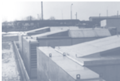
Fot. 1. Obudowy dźwiękochłonno-izolacyjne agregatów pompowych