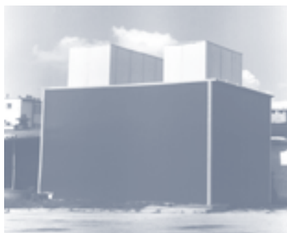
Fot. 3. Obudowa dźwiękochłonno-izolacyjna zespołu skraplaczy

Warstwowa ścianka korpusu wentylatora: blacha stalowa – 2 mm, płyta izolacyjna ARMAFLEX – 25 mm, płyta warstwowa klejona z blachy aluminiowej – 1,05 mm (trzy blachy aluminiowe o grubości 0,35 mm)