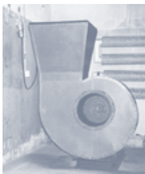
Fot. 2. Korpus wentylatora promieniowego o zwiększonej izolacyjności akustycznej

Warstwowa ścianka korpusu wentylatora: blacha stalowa – 2 mm, płyta izolacyjna ARMAFLEX – 25 mm, płyta warstwowa klejona z blachy aluminiowej – 1,05 mm (trzy blachy aluminiowe o grubości 0,35 mm)